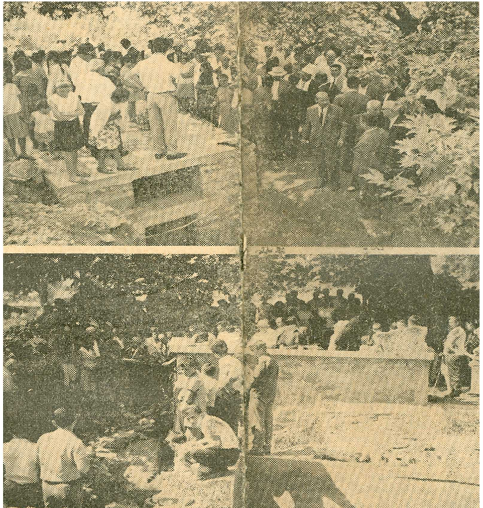
Κάτοικοι τοῦ χωριοῦ Βάστα, ἐκδρομεῖς τοῦ Συλλόγου Βασταίων παρακολουθοῦν τὴν τελετὴν τῶν ἐγκαινίων εἰς τὴν πηγὴν «Κρούα» (ἄνω) καὶ «Ζεστή» (κάτω)